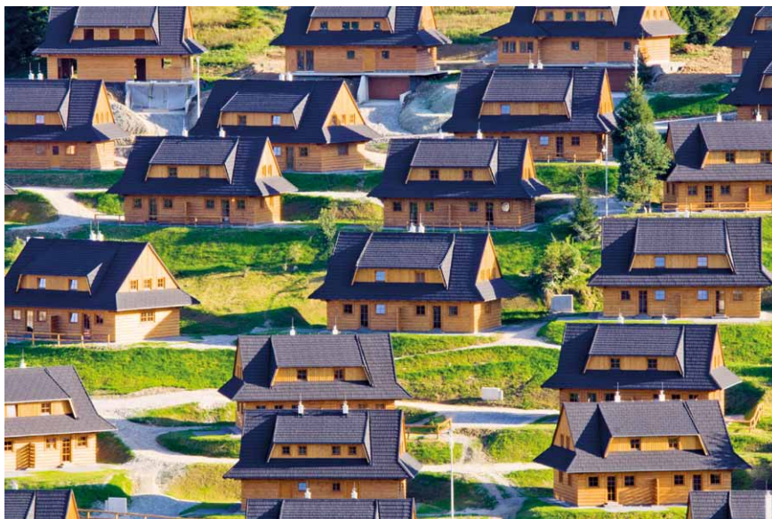
Terchová, Rezort Drevenice Terchová