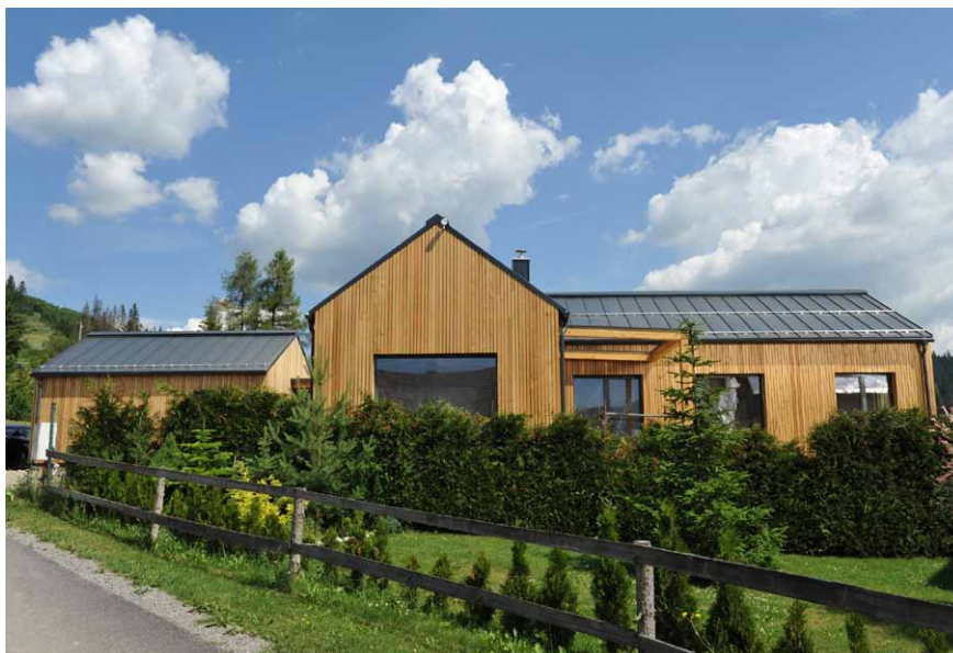
Orava, Rodinný dom, autor: INARDEX, Ing. arch. Fero Lehocký