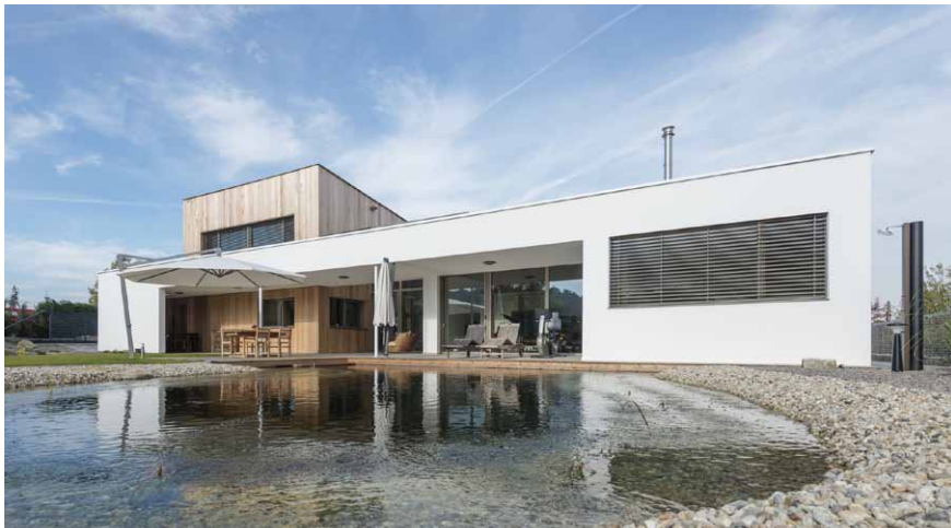
Záhorská Bystrica, Vila Záhorské sady, autor: Ing. arch. Pavol Pokorný

mujúci výraz stavby. Súčasťou kvalitatívnych parametrov sú aj stavebno-fyzikálne vlastnosti konštrukcii, často excelentný statický koncept, primeraná energetická náročnosť objektu a koexistencia a súlad všetkých technických zariadení budovy. A pri montovaných stavbách z dreva aj náročnejšie riešenie požiarnej bezpečnosti stavby a vzduchotesnosti. Toto musí byť, ako hovorí môj skvelý spolupracovník architekt Pavol Pokorný, symfonický orchester. Od toho, ako je orchester zohratý, závisí dojem z koncertu. Ak tím začína spoločne pracovať od štúdie, tak spravidla pri realizačnej dokumentácii je to už zohraté teleso. Žiaľ, často sa stretávame až s neochotou, prizývať k riešeniu odborníkov a nie je výnimkou projekt pre stavebné povolenie, spracovaný sólistom – architektom vo všetkých profesiách. Viacerí architekti vnímajú profesijných odborníkov ako nutné zlo, otravujúce ich pri tvorivej práci. To je to najzložitejšie. Nehovoriac o tom, že presvedčiť investora, že drevená konštrukcia je dobrá voľba z hľadiska budúcej úžitkovej hodnoty stavby, z hľadiska ekonomického, ale aj z hľadiska ekologického, je niekedy to najťažšie pri začiatku realizácie. A potom, že zaradenie našich služieb – projekty, výrobky a dodávka s montážou – je jeho správna voľba. V našom tíme sme za roky existencie nazbierali ohromné množstvo skúseností, ktoré sú k dispozícii investorom, architektom a projektantom. Ak investori tieto skúsenosti využijú, bezpečne ich prevedieme procesmi a úskaliami ich investície.“