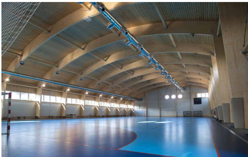
Cífer, Telocvičňa, autor: Ateliér DV, Ing. arch. Pavel Ďurko

O tejto etape svojho podnikania hovorí: „Strechy stavíme a rekonštruujeme od roku 1992. Naučili sme sa strechám rozumieť a pochopiť fyzikálne procesy, ktoré v nich prebiehajú. Pomáhame majiteľom striech predlžovať ich životnosť a zlepšovať ich kvalitatívne parametre. Ovládame technológie pásov z modifikovaných asfaltov a všetky dostupné fóliové systémy, skladané krytiny aj krytiny plechové. V našej náplni sú strechy šikmé, aj ploché, jednoplášňové, dvojplošňové, zelené, duo strechy aj strechy s obráteným poradím vrstiev. Vieme zhotoviť krytiny na guľové aj parabolické plochy, izolujeme mosty aj bazény. Na všetky nami dodávané stavby spracovávame projektovú a výrobnú dokumentáciu. Naš