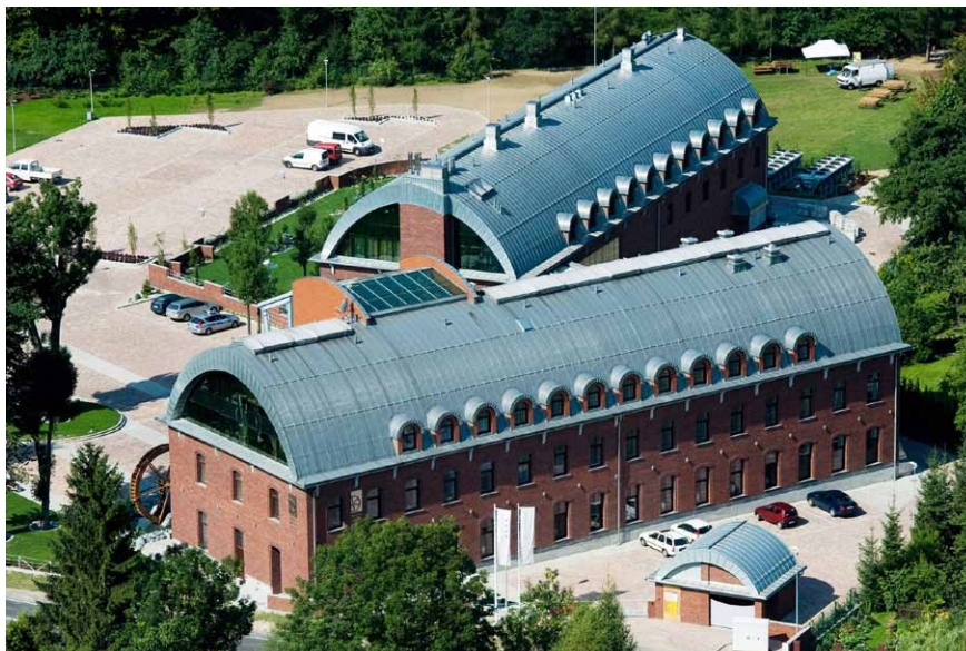
Jaroszowice, Młyn Jacka Hotel & Spa****, autor: Dipl. Ing. Andrzej Spisak