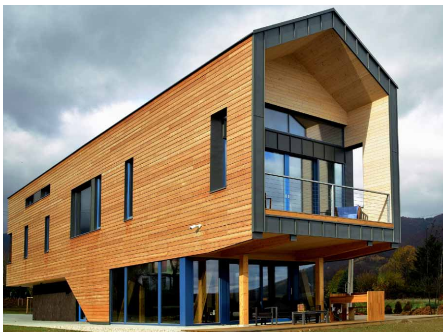
Vrútky, Rodinný dom, autor: Van Jarina, Ing. arch. Ivan Jarina

tim tvoria kvalifikovaní inžinieri, stavbyvedúci aj remeselníci, vďaka čomu sme schopní vyriešiť teoretické stavebno-fyzikálne problémy strechy a zabezpečiť tak jej bezpečnú funkciu. Sme pripravení pracovať aj v extrémnych podmienkach s použitím horolezeckej techniky a naše bohaté technické aj praktické skúsenosti sú k dispozícii všetkým našim partnerom.“